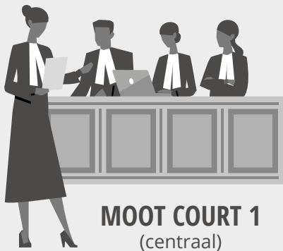
MOOT COURT 1 (centraal)