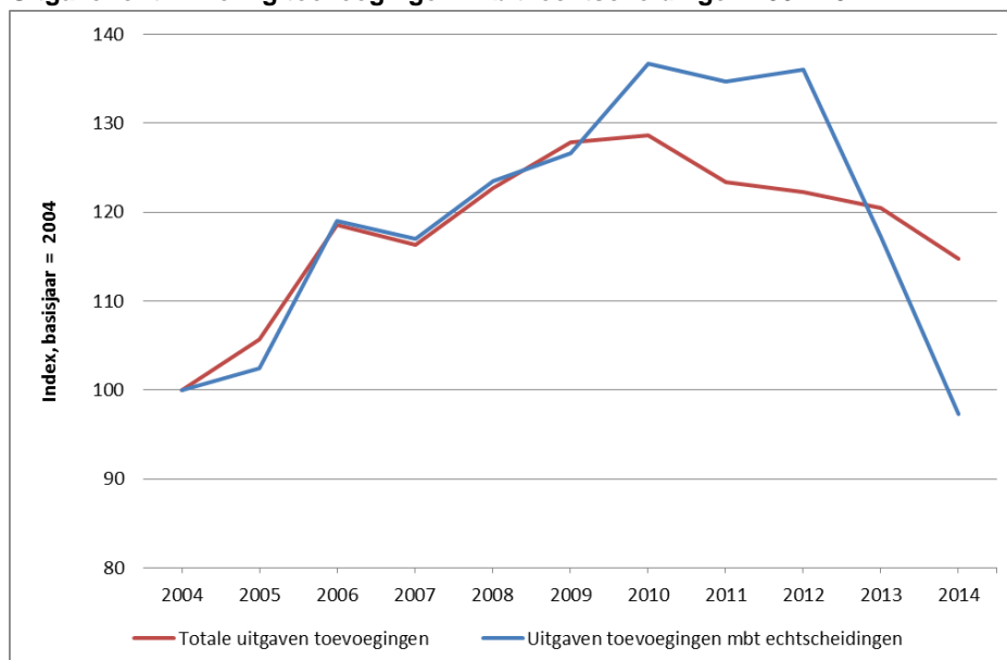
Uitgavenontwikkeling toevoegingen m.b.t. echtscheidingen 2004-2014

In onderstaande figuur is de ontwikkeling van de echtscheidingsgerelateerde toevoegingen 18 met deze zaakcodes weergegeven. Tot 2009 volgen de echtscheiding gerelateerde toevoegingen de algemene trend, weergegeven met een rode lijn. In 2010 is er, ten opzichte van de algemene trend, een relatief sterke stijging. Pas in 2012 zet de verwachte daling in. Die daling is overigens heel sterk. 19 In 2014 ligt het aantal echtscheiding gerelateerde toevoegingen daardoor onder het niveau van 2004.